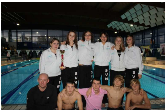
Groupe compétition, Meeting de Pontault / Combault 2009

Port de plaisance 76460 Saint-Valéry-en-Caux Tél 02 35 57 88 00 Fax 02 35 57 88 88 contact@hotel-casino-saintvalery.com