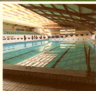
Grand bassin 50 m 8 lignes

OUVERTURE DES PORTES : 13h30 DEBUT DES EPREUVES :14h15 400m NL 50m papillon 50m dos 100m brasse 200m papillon 100m NL 200m dos 400m NL Relais 4x100m 4N dames, messieurs, mixte